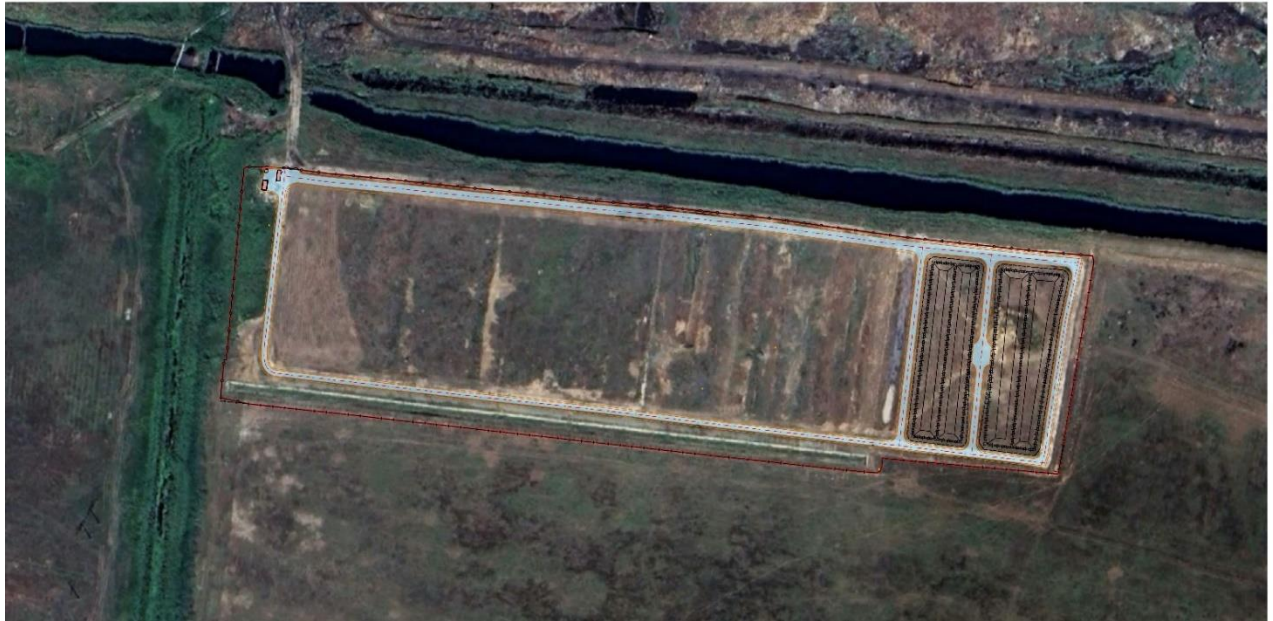
Рисунок 1.4.1 – Обзорная схема

В административном отношении объект располагается в Волгоградской области, Среднеахтубинский муниципальный район, Красное сельское поселение. Кадастровый номер земельного участка 34:28:060001:51. Объект представляет собой действующий полигон промышленных отходов. Обзорная схема представлена на Рисунке 1.4.1.